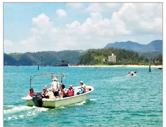
船に乗って辺野古・大浦湾めぐり

※参加費用内訳：飛行機・宿泊2泊・船・レンタカー・ガイド料・保険・食事（1日目の夕食～3日目の昼食まで）