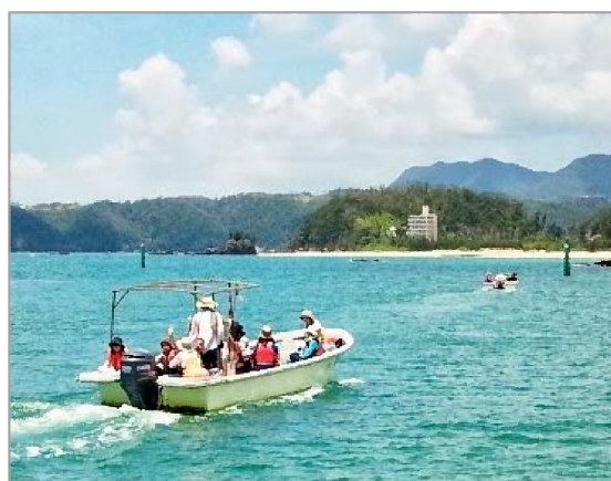
船に乗って辺野古・大浦湾めぐり