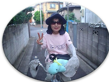
自転車の前カゴにジュゴンが♪

全国からお寄せいただいた、写真とメッセージを、web上で公開したいと思います。ぜひ、 info@sdcc.jp までお送りください。